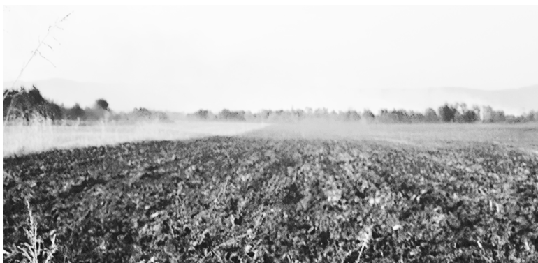
Поле между селами Кирово и Коста после сжигания растительных остатков.

Массовое сжигание листьев приводит к такому загрязнению атмосферы, которое сравнимо с мощными промышленными выбросами. Ухудшается самочув-